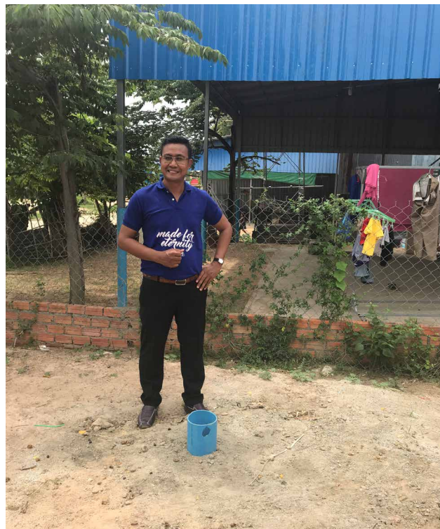
Questa è la posizione originale del pozzo numero 2. Il buco è nel frattempo stato chiuso.

Per adattarsi alle situazioni contingenti ci sono stati un paio di cambiamenti.