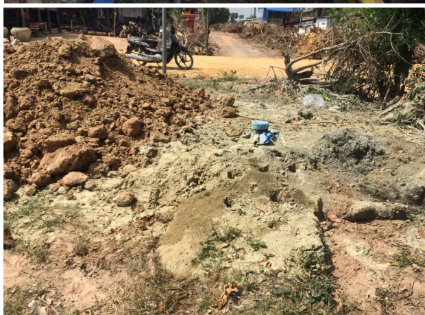
Durante la nostra visita il 6 giugno 2018.